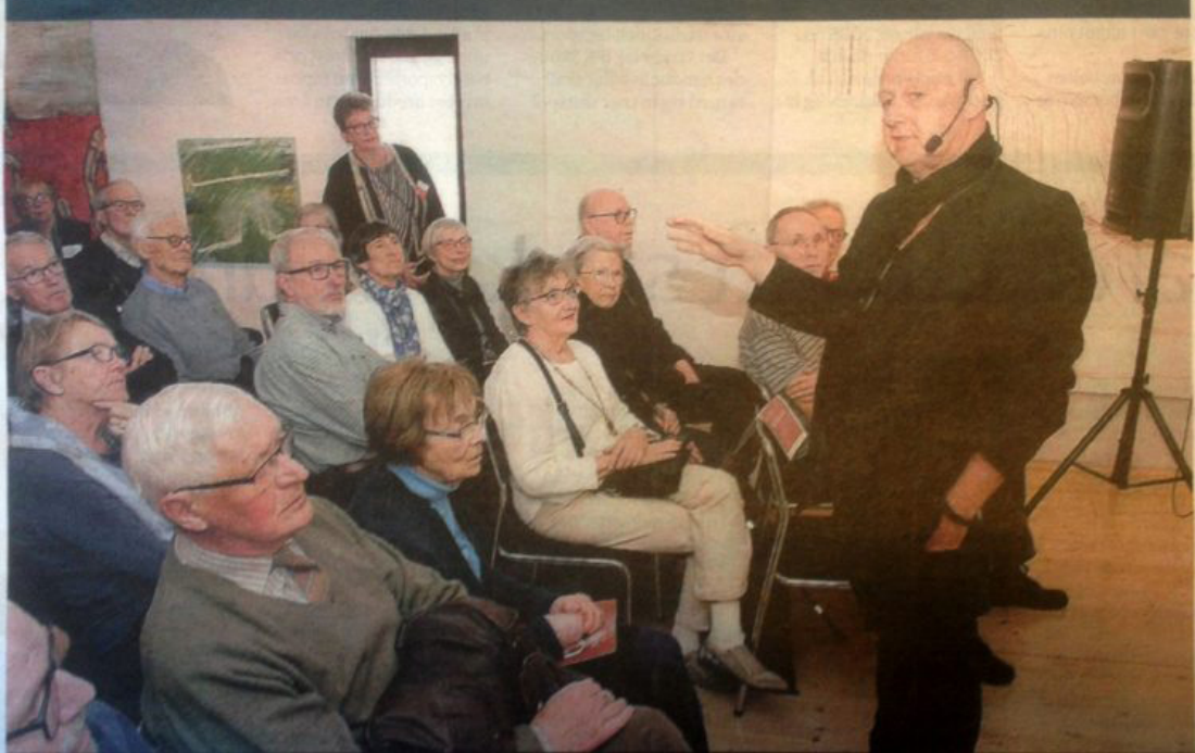
FULLSATT. Det var stor uppslutning när arkitekten Gert Wingårdh invigde utställningen om Hans-Erland Heineman i Konstmuseet under lördagen. Han berättade om Hans-Erland och beskrev Kulturhuset, som ju Heineman ritat som: "Ett stort stycke arkitektur". 56