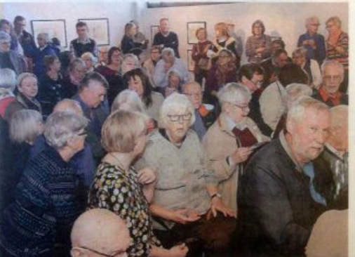
Många kom till invigningen.