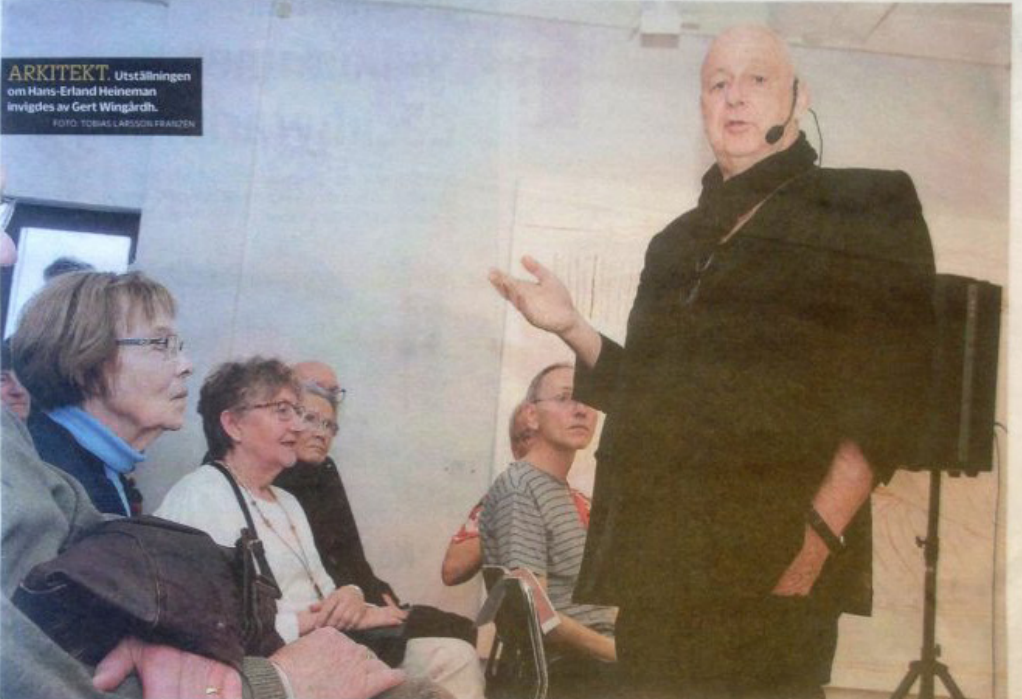
ARKITEKT Utställningen om Hans-Erland Heineman invigdes av Gert Wingårdh.