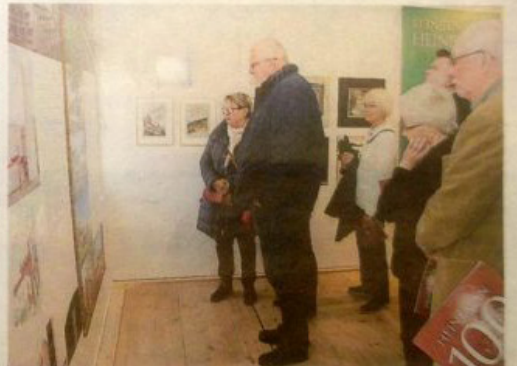
Utställningen visas fram till 18 maj.